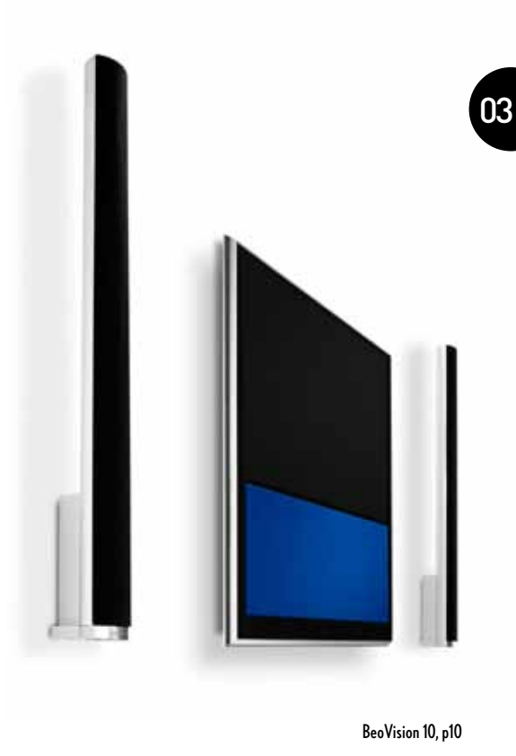
BeoVision 10, p10