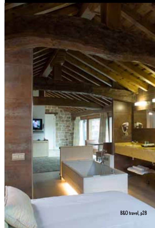
B&O travel, p28