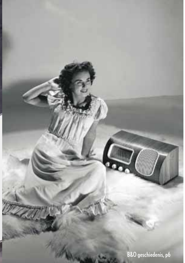
B&O geschiedenis, p6