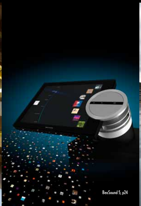
BeoSound 5, p24