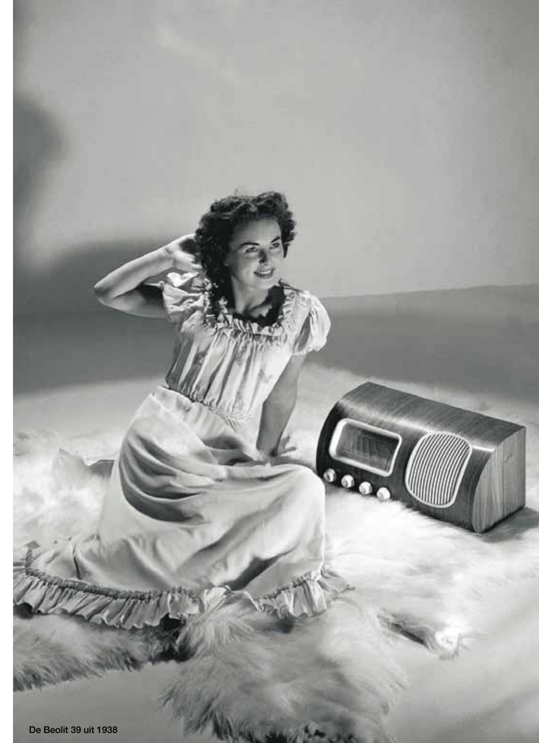
De Beolit 39 uit 1938

Na 85 jaar legt Bang & Olufsen zich nog steeds niet neer bij 'gewoon' en blijft op zoek naar 'buitengewoon'. Het uiteindelijke doel is onveranderd: het beste van het beste, op ieder gebied en in iedere fase, van het experimenteren tot de ontwikkeling, van het ontwerpen tot het produceren, van de materiaalkeuze tot de zorg voor de klant.