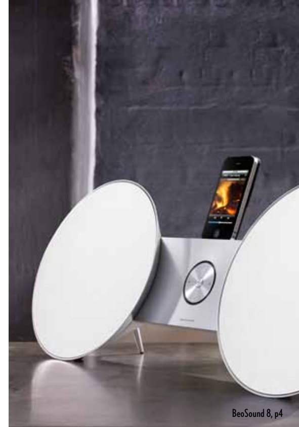
BeoSound 8, p4

Deze special is mogelijk gemaakt door RESIDENCE