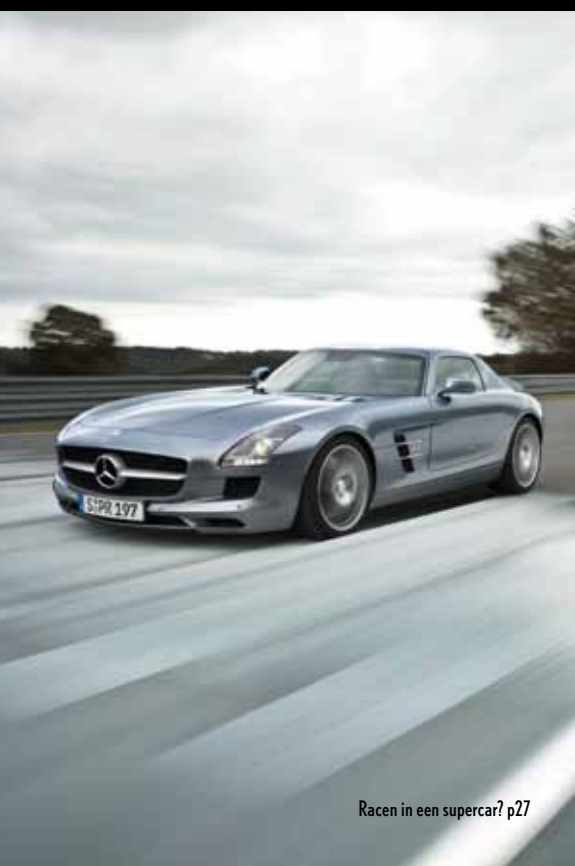
Racen in een supercar? p27