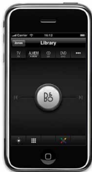
Met de Bang & Olufsen app op de iPad of iPhone kunt u uw hele huis bedienen.

Bang & Olufsen heeft zich nooit laten afremmen door conventies. Klanten kunnen al jaren genieten van de meerkamer-functionaliteit in home entertainment-systemen. Terwijl anderen zich nu pas bewust worden van de voordelen van het onderling verbinden van audiovisuele systemen in huis, is Bang & Olufsen continu bezig zijn baanbrekende BeoLink-systeem te voorzien van geraffineerde, nieuwe mogelijkheden.